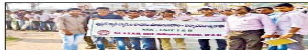
ప్రదర్శనలో పాల్గొన్న విద్యార్థులు