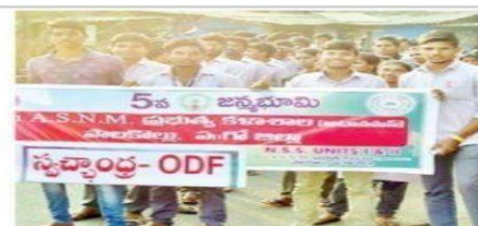
ర్యాలీ నిర్వహిస్తున్న ఎన్ఎస్ఎస్ వలంటీర్లు